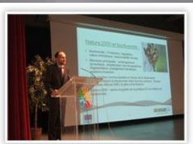
Rencontre Intersolognote 2009 « Natura 2000 en Sologne » en partenariat avec le Pays de Grande Sologne. Ci-contre, Joseph Van der Stegen (directeur du bureau Biodiversité, Bruxelles)

Lors du comité de pilotage du site « Sologne » le 5 novembre dernier , les services de l'État se sont félicités des premiers résultats de l'animation du site Sologne réalisée par le CRPF, sous la présidence du Pays (compte rendu adressé aux membres du comité d'ici la fin du mois de janvier).