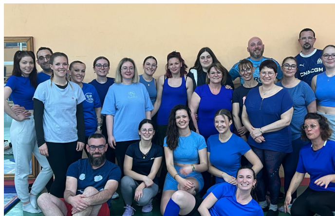
12 ©Satinka danse