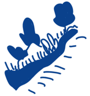
Fleuves et zones humides