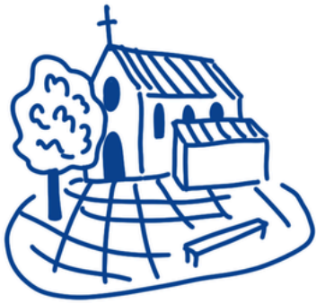
Espaces publics urbains