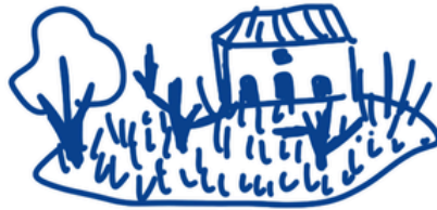
Friches et espaces délaissés